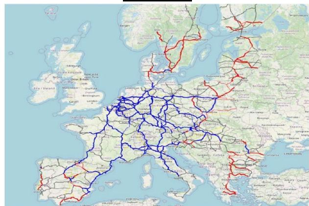
EU Extended Core Network (77,240 kms)