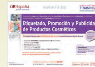
Etiquetado, Promoción y Publicidad de Productos Cosméticos Barcelona • 29 de Septiembre de 2015