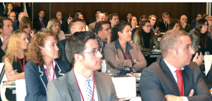
SERIALIZACIÓN y BPD