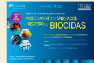
Procedimiento de Aprobación y Registro de Biocidas Barcelona • 29 de Septiembre de 2015