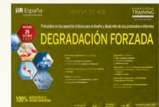
Degradación Forzada Barcelona • 29 de Octubre de 2015