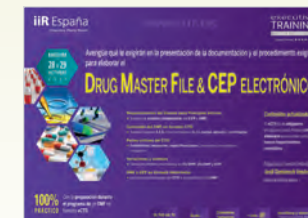
Drug Master File & CEP Electrónico Barcelona • 28 y 29 de Octubre de 2015