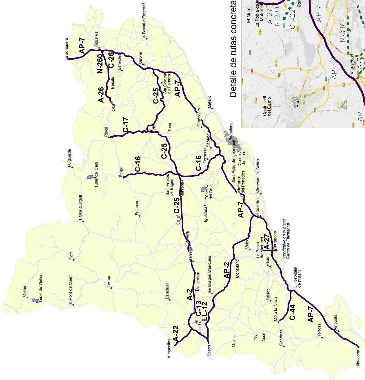
Detalle de rutas concretas Camp de Tarragona